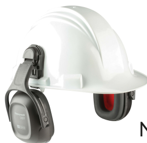
NRR25 VERISHIELD VS120DH