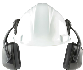
NRR27 VERISHIELD VS130DH