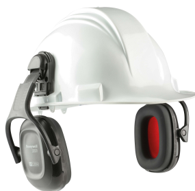
NO DISPONIBLE ACTUALMENTE NRR23 VERISHIELD VS110DH